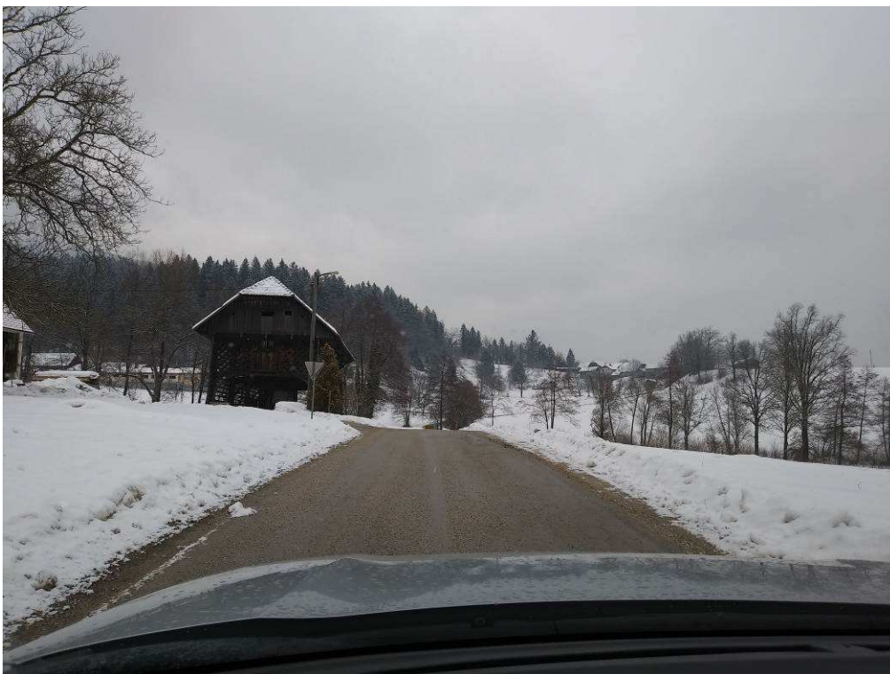
Slika 3: Pogled na traso