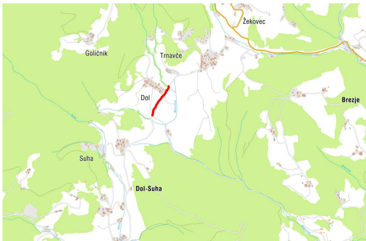
Slika 1: Lokacija odseka

Na osnovi naročila občine Rečica ob Savinji smo izdelali tehnično dokumentacijo za javni razpis rekonstrukcije lokalne ceste LC 267-061 v skupni dolžini 316,00 m.