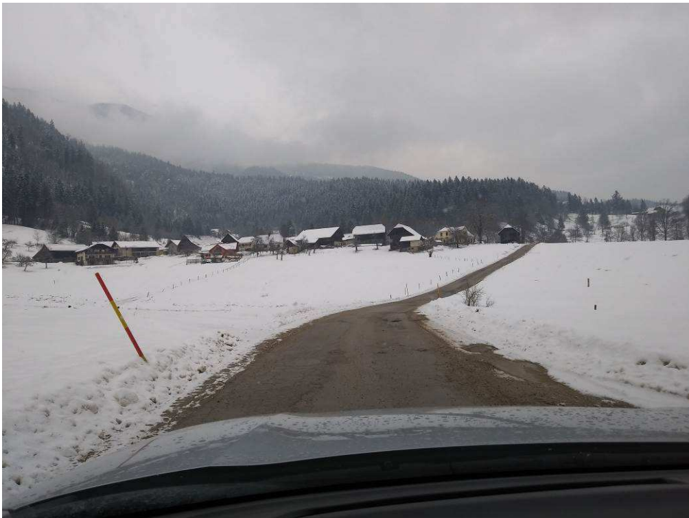
Slika 2: Začetek trase