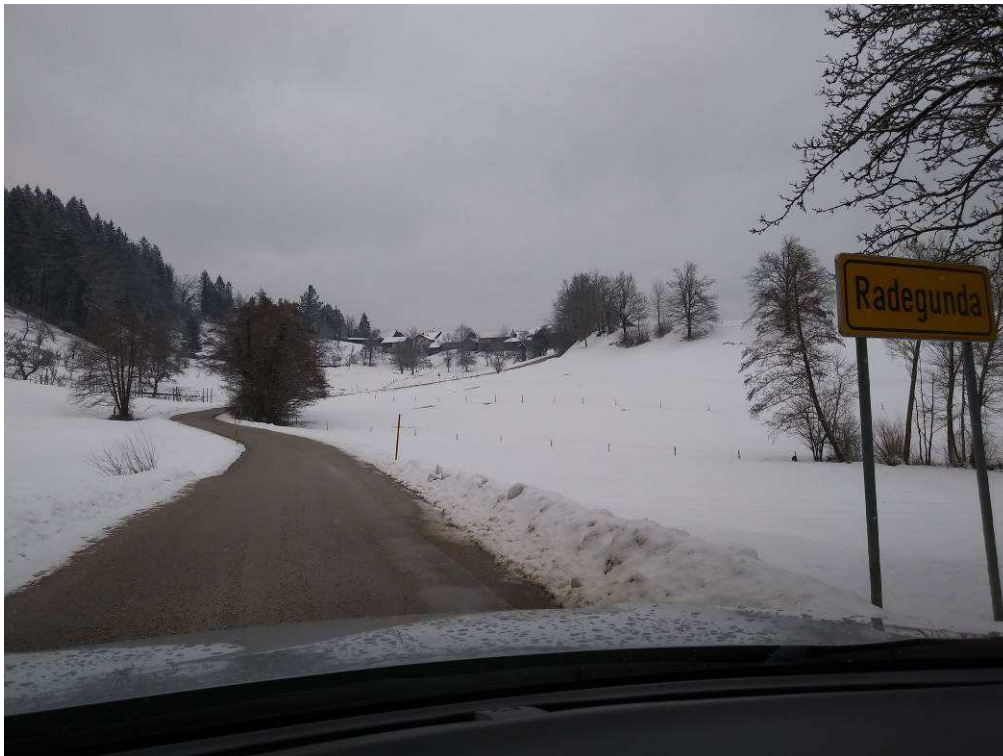
Slika 4: Konec trase